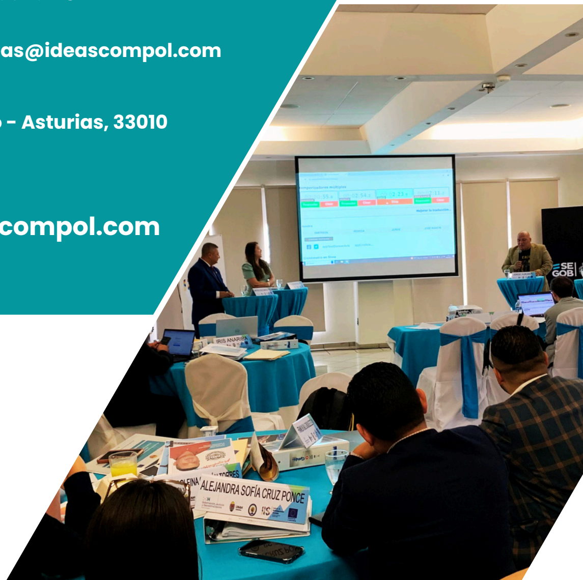
Foto: Jornada presencial actividad de cierre "Debate presidencial".